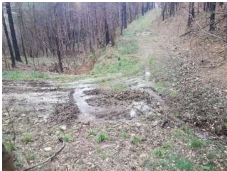
Slika 1: Vzdrževalne ukrepe za vzpostavitev ali povrnitev prevoznosti in zagotovitev odvodnjavanja lahko delajo in načrtujejo upravičeni uporabniki prometnic sami

Vzdrževanje gozdnih vlak pa je v veliki meri prepuščeno samim pooblaščenim uporabnikom. Šele zadnji razpis SKP predvideva tudi sofinanciranje ukrepa »protierozijsko vzdrževanje gozdnih vlak«, ki pa še ni ustrezno definirano in zastavljeno. Za koriščenje sredstev s tega naslova, bo moral ZGS predhodno pripraviti elaborat teh vzdrževanj. In te dotične smernice lahko služijo tudi kot pomoč pri pripravi teh elaboratov.