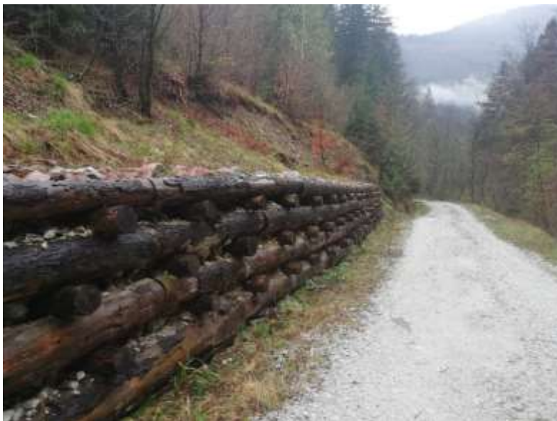
Slika 9: Podporni in oporni elementi so detajlneje predstavljeni v naslednjem projektne poročilu (3.3)

Taki elementi so: kamnometi in kamnite zložbe v suhem ali v betonu, kašte, zidovi, gabioni in drugi,... Tem elementom je detajlno namenjeno poročilo 3.3 (Katalog tehničnih rešitev, ki zagotavljajo varstvo pred erozijo v gozdu).