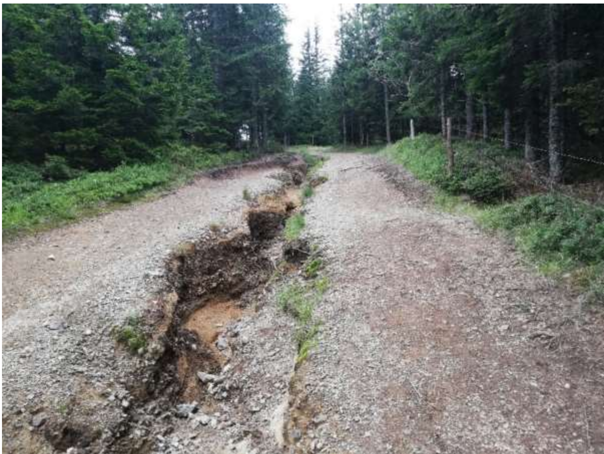
Slika 4: na močno erodibilnih podlagah so lahko že nizki nakloni problematični in je na njih potrebna umestitev prečnih jarkov

V kolikor se bo v prihodnje omogočilo gradnjo odsekov utrjenih gozdnih poti tudi s prečnim nagibom proti zunanji strani, je potreba pri takih poteh po prečnih jarkih bistveno manjša.