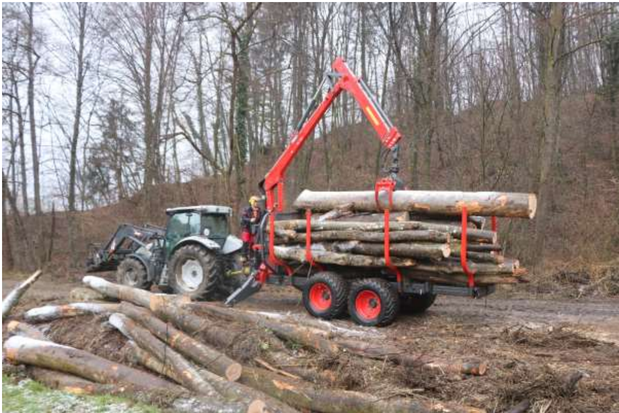
Slika 3: Vlačenje lesa po tleh ni več edina možna raba gozdnih vlak. Obstajajo tudi druge oblike spravila lesa in upravičene rabe vlak, ki ne potrebujejo nujno prečnih naklonov pobočnih vlak navznoter.

V gozdnem prostoru se poleg gozdnih cest, protipožarnih prometnic in gozdnih vlak, namenjenih vlačanju lesa nahaja še veliko drugih »upravičenih« prometnic, ki so lahko po trenutni zakonodaji razvrščene zgolj med gozdne vlake – s tem pa posredno dobijo tudi zahtevo po določenem prečnem naklonu. Tovrstne prometnice bi lahko grobo uvrstili v kategorijo utrjenih gozdnih poti, ki navkljub podanim predlogom iz preteklosti, še ne obstaja. Sem bi se lahko uvrščale pomembnejše gozdne vlake (večinoma utrjene), prednostno namenjene spravilu lesa z vožnjo (npr. z gozdarskimi prikolicami), vaški kolovozi prednostno namenjeni gospodarjenju s kmetijskimi zemljišči, ter servisne poti prednostno namenjene vzdrževanju vodne ali gospodarske infrastrukture v gozdnem prostoru. V kolikor slednje prometnice niso opredeljene kot gozdne vlake, ali izločene iz maske gozda, so po trenutni gozdarski zakonodaji (tudi če so speljane po javnem dobrem, ali z vpisanimi služnostmi) nelegalne. Na vseh teh prometnicah bi morala biti omogočena tudi druga izvedba prečnega naklona, ne izključno na notranjo stran, skladno s priporočili načrtovalca/projektanta.