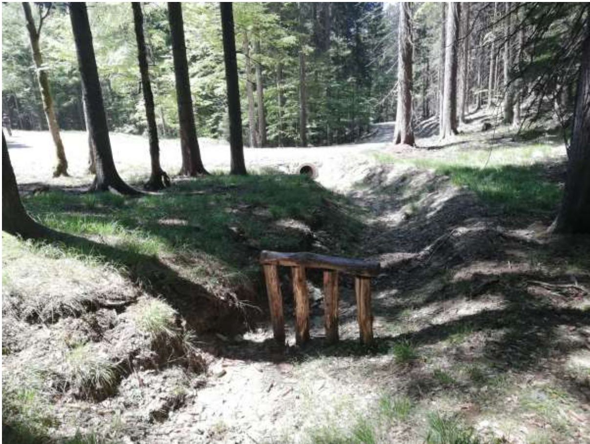
Slika 5: enostaven lovilni element nad cevnim prepustom gozdne ceste, namenjen prestrezanju plavja

Ocena podnebnih sprememb v Sloveniji do konca 21. stoletja. ARSO, Ljubljana 2018