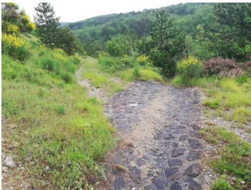
Slika 8: utrjena mulda na gozdni vlaki