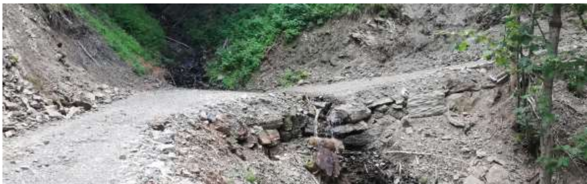
Slika 7: Mulda na gozdni vlaki

Alternativna možnost cevnim prepustom je mulda. Mulda je utrjen krajši odsek gozdne prometnice konkavne oblike, namenjen neoviranemu pretoku vode (načeloma hudournika).