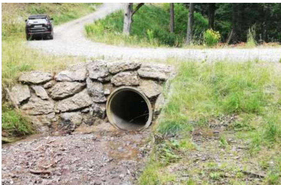
Slika 6: Večji cevni prepust na gozdni cesti

Zaradi vsega naštetega predlagamo poenostavljeno oceno odtoka iz vodozbirnih območij, manjših od okvirno 50 ha, ki bi lahko poenostavila, pospešila in pocenila postopek pridobivanja potrebnih soglasij pri umeščanju novih gozdnih vlak (izjemoma tudi pri nujni gradnji cest) v prostor. Od snovalca vlake bi namreč zadostovalo, da bi ta določil površino vodozbirnega območja in sledil tipskemu predlogu prečkanja iz nadaljevanja. Površina vodozbirnega območja je namreč najlažje določljiva veličina hidravličnih izračunov, v kolikor ni prisotnosti večjih izvirov, ki se napajajo izven vodozbirnega območja površinskih voda. Na slednje moramo biti pozorni predvsem pri različni matični podlagi znotraj vodozbirnega območja. Določitev površine vodozbirnega območja lahko določi že avtor elaborata vlake, ta pa je preverljiva tudi s strani ostalih soglasodajalcev.